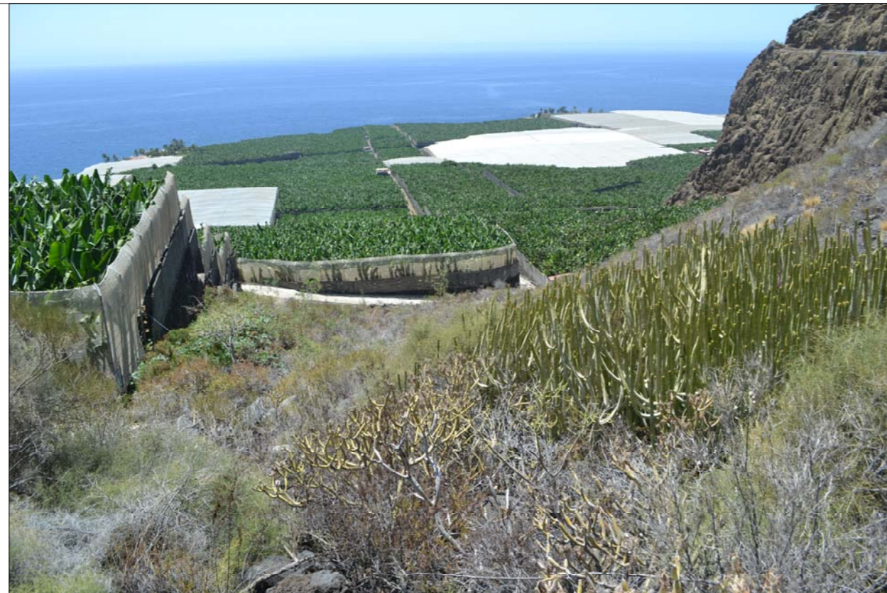
3- Desde las laderas de Charco Verde, lomos de "Parolinea aridanae", se tiene esta visual donde se aprecia calle de finca que define el límite sur de la actuación, y del ENP-P16. A la derecha está el roque sur de Toba hialoclastítica.