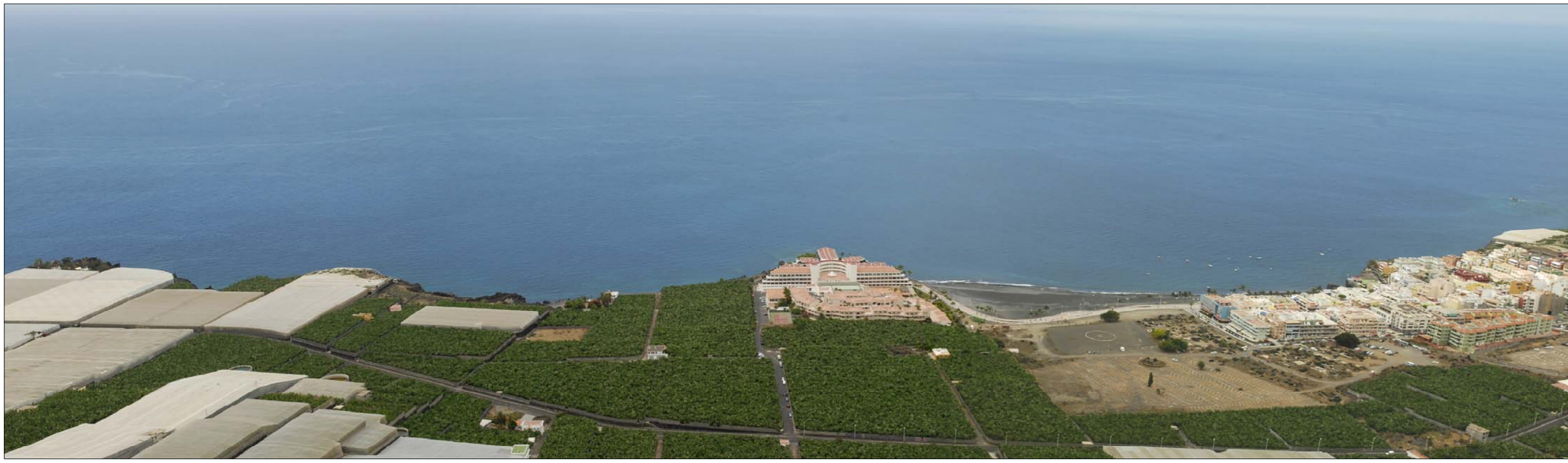
1- Desde el acantilado sobre la plataforma costera se tiene una visual amplia y comprensiva de todo ese espacio litoral, aunque son puntos panorámicos de difícil acceso. Vemos el núcleo urbano de Puerto de Naos y la extensión agraria hacia el sur, con LP-213 que define la zona de actuación.