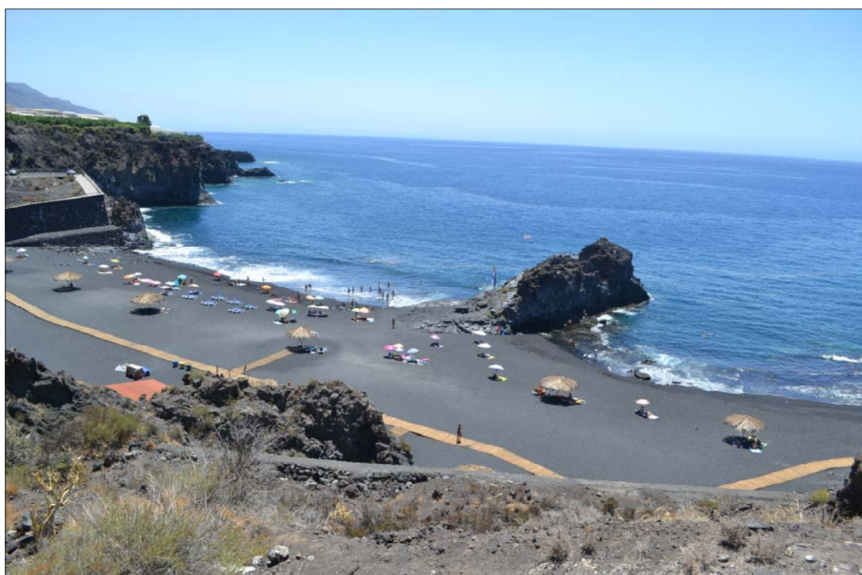
Equipamientos de playas dotadas con que cuenta el municipio: Charco Verde (izq-6) a unos 400 del límite sur de la actuación; y Puerto de Naos (dc-7), ocupando el frente de este núcleo y lindando con el sector norte de la actuación.