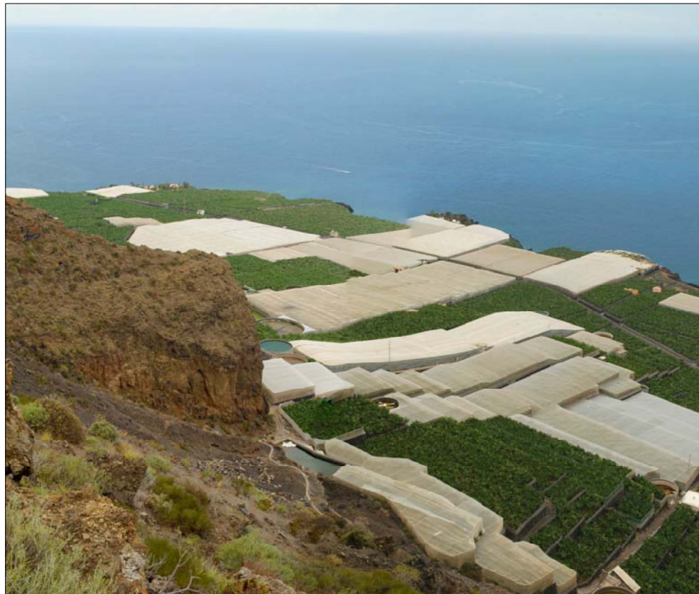
2- Desde el mismo lugar de corniza de acantilado se fuga hacia el sur el espacio de actuación, manto de plataneras en buena parte bajo protección de malla plástica. Vemos en primer plano el domo norte de toba hialoclastítica.