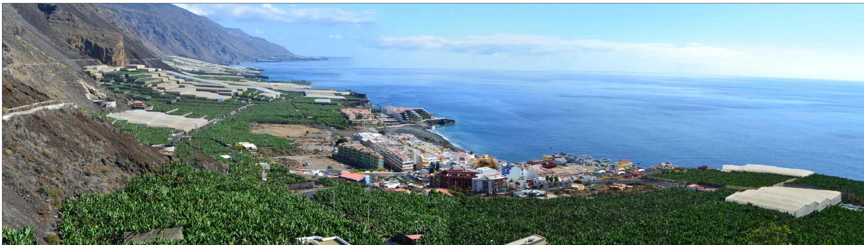
5- Visual norte-sur de la plataforma costera: núcleo de Puerto de Naos y el potente entorno agrario, con esta perspectiva del litoral oeste que se pierde hacia Fuencaliente.